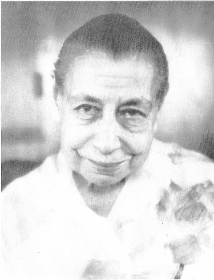
МИРРА АЛЬФАССА (МАТЬ)